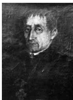
Gieriet G. Franzestg

En igl urbari dalla pleiv a Sedrun stat ei scret tier il datum da sia mort: Fuit sacerdos in omni scientiarum genere pereruditus, zelatissimus pro salute animarum et probitate vitae et fautor pauperum.» – Sur Decan Hetz ei staus il davos plevon da Tujetsch, ch'igl avat da Mustér ha presentau alla Curia episcopala ed il davos spiritual, ch'ei vegnius satraus en baselgia a Sedrun. Tujetsch ha fatg sut decan Hetz 1827 per la davosa gada la processiuin sil S. Gottard, che cuzzava mintgamai dus dis, ils 28 e 29 da zercladur. Persuenter ei vegniu menau en la processiuin a Tschamut per il di da s. Pieder e s. Paul, la quala ins ha dismiss ils 11 da fevrer 1912 e remplazzau ella cun ina processiuin a Zarcuns sin il medem di.