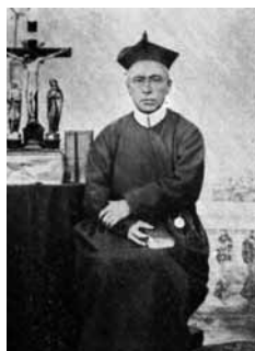
Beer p. Sigisbert

suenther il medem di; sacerdot ils 14 da mars 1847 a Friburg-S., nua ch'el ha fatg atras sco «Feldpater» l'uiara dil «Sonderbund». – Silsuenther ha pader Sigisbert operau sco missiunari ell'Alsazia ed el ducat da Baden.