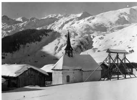
S. Onna a Camischolas

Suandontas veglias processiuins dalla pleiv da Tujetsch ein vegnidat fatgas per la davossa gada: la vigelgia da s. Gion Battesta a Segnas 1904, da s. Gieri a Mustér 1907, da s. Martin a Mustér 1907, da s. Pieder e s. Paul a Tschamut 1911. Persuenter vegn ei fatg ussa sin quels dis da Sedrun anora ina processiuin a Zarcuns.