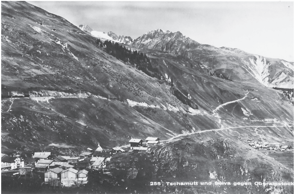
255 Tschamutt und Salva gegen Oberalpstock

In den Jahren 1910 bis 1912 ist die Bahnstrecke von Ilanz nach Disentis ausgebaut worden. Am 1. August 1912 traf der erste Zug der RhB reichlich geschmückt in Disentis ein. 1912 begann man von Disentis aus die Strecke Disentis–Andermatt für die Furka-Oberalp-Bahn auszubauen und am 3. Juli 1926 wurde die Gesamtstrecke Disentis–Brig eröffnet. In dieser Zeit waren ca. 3000 Arbeiter auf dem Gebiet zwischen Disentis und Brig beschäftigt.