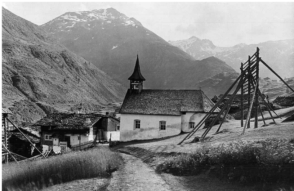
La baselgia da Selva

Pervia dalla fundaziun d'ina caplania a Selva han ils vischins da Selva e Tschamut giu endamen cun uestg Gion VI Flugi d'Aspermont 1658, essend el vegnius quei onn a Tujetsch per cresmar e far visitaziun. Definitivamein ei il benefeci dalla caplania vegnius fundaus pér 1665 ed approbaus dalla Curia episcopala ils 13 da mars 1666. Deputai da Selva e Tschamut ein stai serendi tier igl uestg cun ina brev da landrehter Conradin de Medell (†1. zercladur 1691) il qual ha giu recumandau cauldamein la caussa da ses cumpatriots. La brev da landrehter Conradin sesanfla egl archiv episcopal a Cuera e porta sia arma cun il datum: «Davetsch den 10. Merzen 1666.»