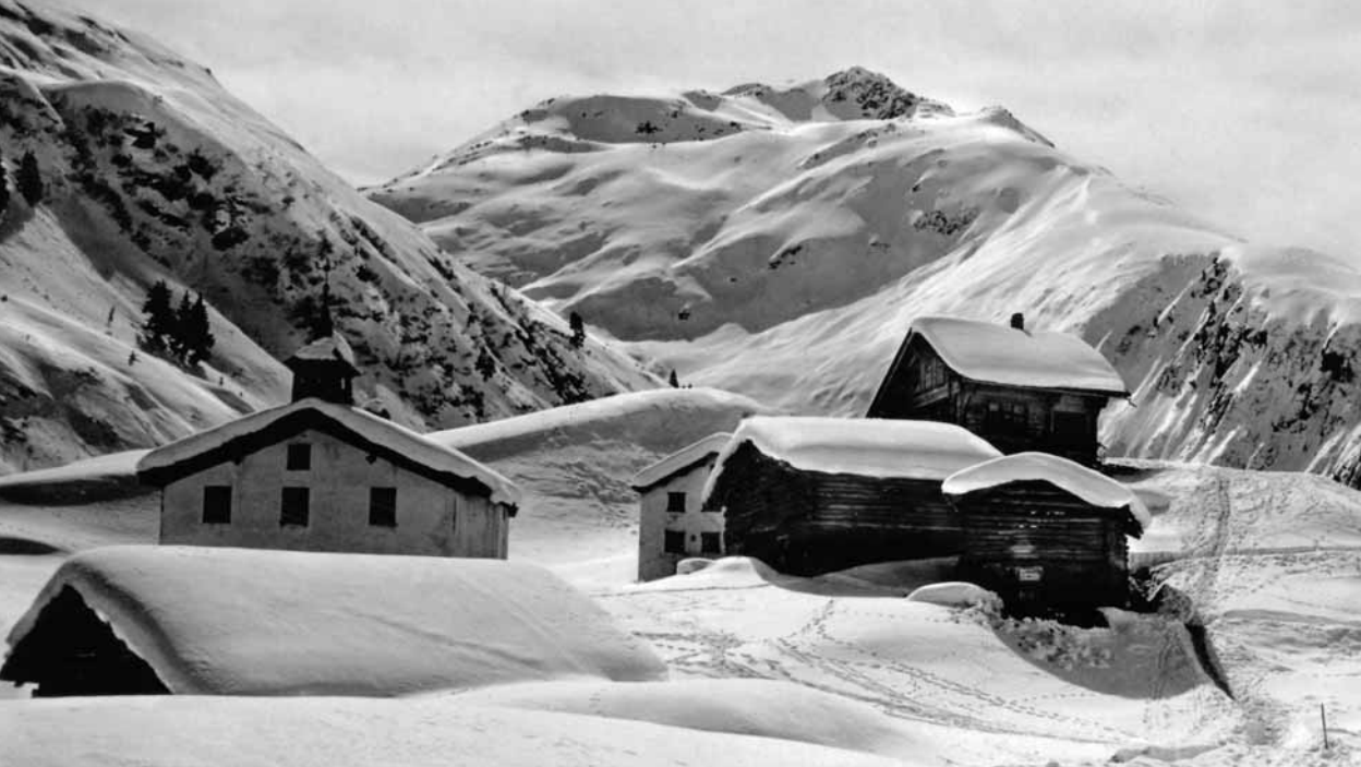
Sutcrestas cun la caplutta